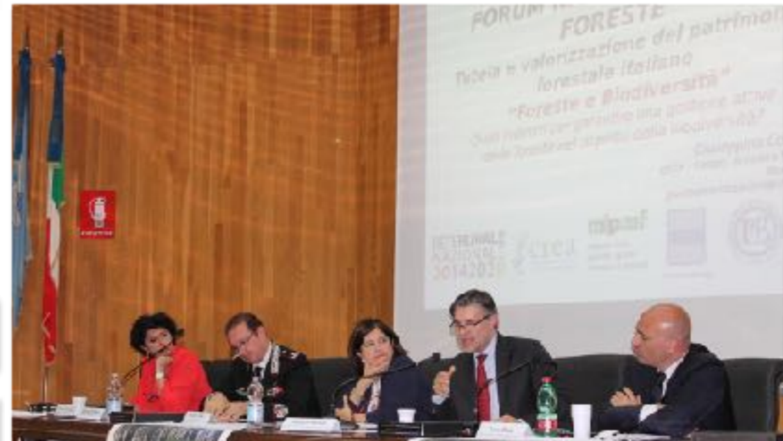
FORUM NAZIONALE FORESTE POTENZA Vice Ministro OLIVERO