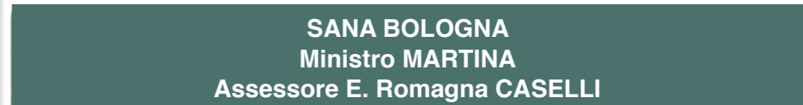
SANA BOLOGNA Ministro MARTINA Assessore E. Romagna CASELLI