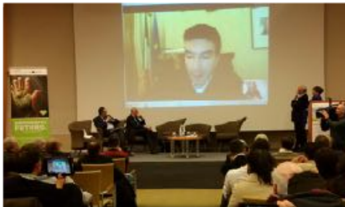
Il Ministro MARTINA con i neo insediati a MATERA

REGIONE BASILICATA DIPARTIMENTO POLITICHE AGRICOLE E FORESTALI