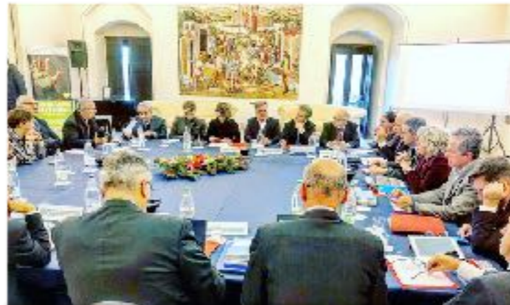
COMMISSIONE POLITICHE AGRICOLE A MATERA