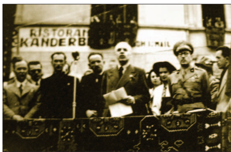
Në foto: (Lart) Mustafa Kruja gjatë një vizite në Kosovë, 1942 (Majtas) Dy faksimile nga dokumentat e Promemories