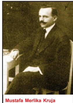
Mustafa Merlika Kruja

Nga pikëpamja etnike, popullsia e këtij sektori është kompaktësisht vëndase shqiptare, e nuk është rasti për t'i dhënë asnjë rëndësi atij numuri të pakët sllavësh (Sërb, Malazez e Bullgaro- Maqedonas), të depërtuar gjatë sundimit otoman. Ky, siç dihet, e lejonte këtë depërtim për nevojë të llojeve të ndryshme, me që traditat luftaraket të Perandorisë kishin bërë që nënshtetësit e besimit mysliman, që formonin popullin sovran, dalngadalë lanë mbas dore veprimtarinë tregtare e in-