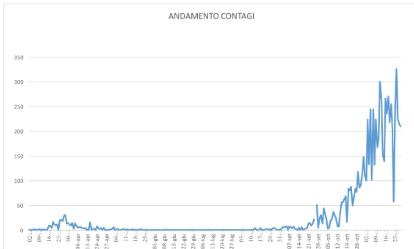
GRAFICO ANDAMENTO CONTAGI