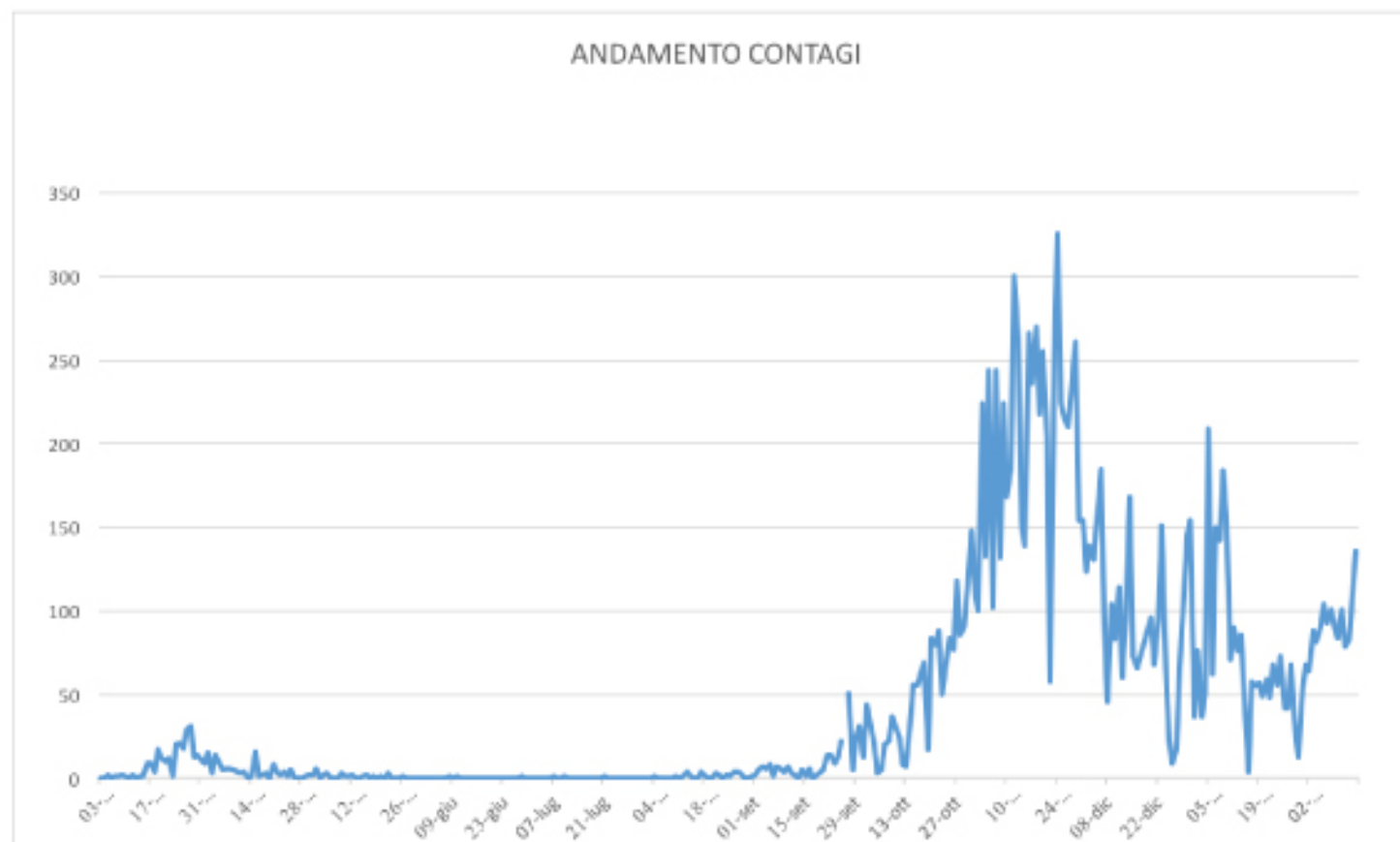
GRAFICO ANDAMENTO CONTAGI