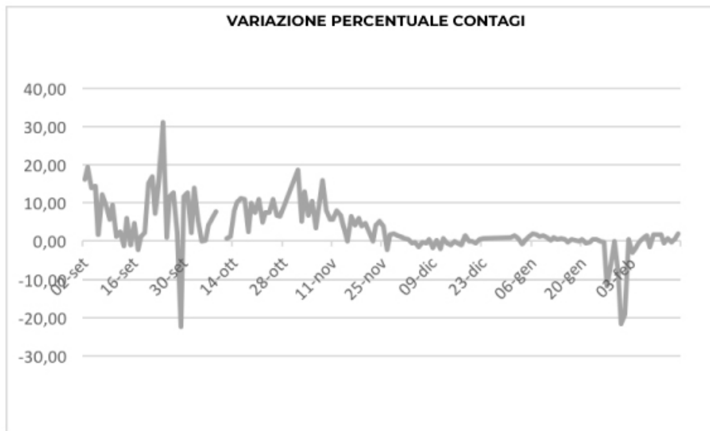
VARIAZIONE PERCENTUALE CONTAGI