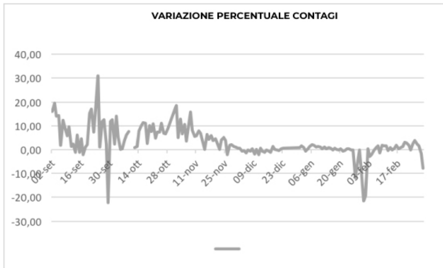
VARIAZIONE PERCENTUALE CONTAGI